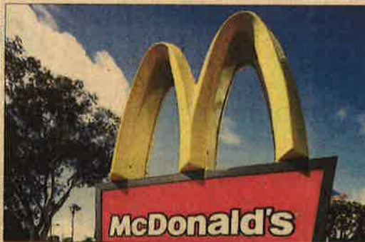
Logotipo de McDonald's en un restaurante de EE UU.

Google se ha comprometido a aumentar la lista de servicios con políticas específicas de privacidad y extender las campañas de recordatorios de privacidad tanto a otros productos de la firma como a los usuarios de Android, según la Agencia Española de Protección de Datos. Este organismo ha comunicado a las autoridades europeas que Google está cumpliendo con los requisitos impuestos en diciembre de 2013 para ajustar su política de privacidad a la normativa española. "La compañía ha introducido modificaciones significativas en la información ofrecida a los usuarios en el consentimiento y ejercicio de derechos".